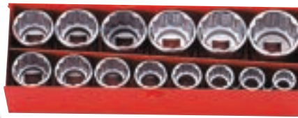
SERIE 14 PZ. CHIAVI A BUSSOLA BOCCA ESAGONALE / POLIGONALE CASSETTA METALLICA 163 X 52 X H 33 MM