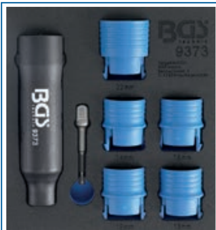
BGS 9373-12 BGS 9373-13