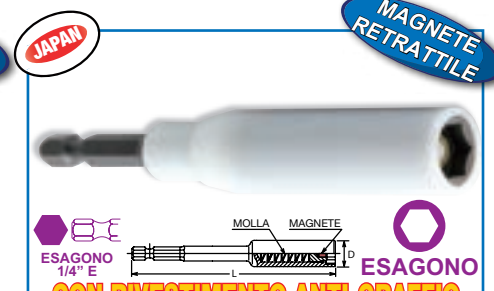
CON RIVESTIMENTO ANTI-GRAFFIO MAGNETE RETRATTILE CON RIVESTIMENTO IN PLASTICA ANTIGRAFFIO

attacco: DIN 3126, E 6,35 impronta: ESAGONO