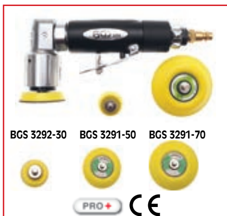
BGS 3292-30 BGS 3291-50 BGS 3291-70