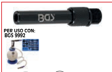
PER USO CON: BGS 9992