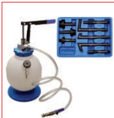
BGS 9992-109 BGS 9992-110 BGS 9992-111