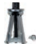
KK 21-89, KK 21-90