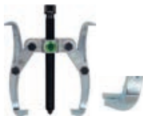
KK 201-2 -- KK 201-3