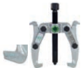
KK 201-0, KK 201-1, KK 201-4