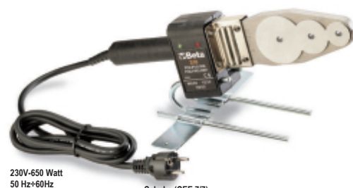
230V-650 Watt 50 Hz÷60Hz