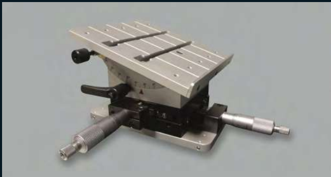
Tavola di posizionamento a 3 assi Tabla de colocación de 3 ejes