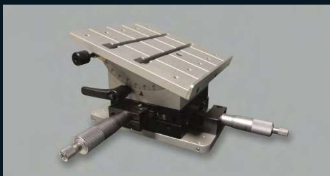
Tavola di posizionamento a 3 assi Tabla de colocación de 3 ejes