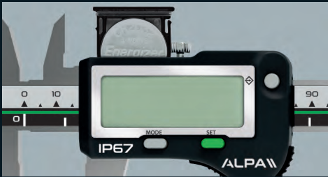
ACC02001 Batteria 3V CR2032 / Bateria 3V CR2032