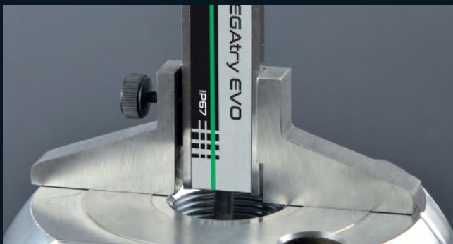
ACC03001 Base di profondità Base de profundidad