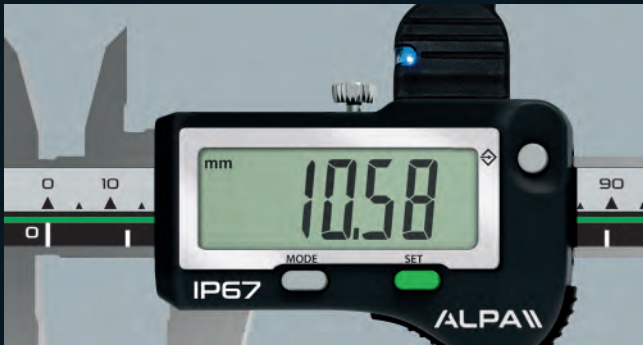
ACC01000 Connettore Proximity RS232 Conector Proximity RS232