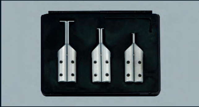
ACC05SET Becchi / Mordazas